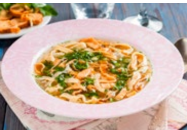
Een kom frittatensuppe

4 Frittatensuppe De meeste soepen zijn gemaakt met heldere runderbouillon. Deze wordt opgediend met diverse garnituren, zoals de frittaten , pannenkoeken met verse kruiden die in dunne repen worden gesneden.