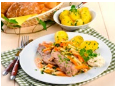
Tafelspitz , Franz Josephs favoriet

5 Tafelspitz Vlees is onmisbaar voor de Weense keuken en rundvlees speelt al eeuwenlang een belangrijke rol. Een geliefde variant is gekookt lendevees, vaak met rösti of gekookte aardappelen en een moes van appels en mierikswortel. Men beweert dat keizer Franz Joseph elke dag tafelspitz at.