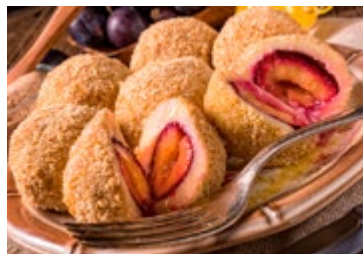
Zwetschgenknödel (met pruimen)

9 Knödel De Weense dumplings worden zowel zoet als hartig gemaakt. De knödel is met groenten en vlees, germknödel met zure pruimenjam, zwetschgenknödel met pruimen, topfenknödel met kaaswrongel en griessnockerl met griesmeel.