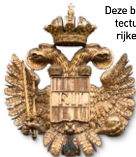
Detail van het interieur van het Theater an der Wien

Deze buurt is rijk aan contrasten. Statische architecturale blikvangers grenzen aan de kleurrijke drukte van de Naschmarkt. U vindt er imposante gebouwen in diverse stijlen, zoals het historische Operagebouw en de Akademie voor Beeldende Kunst, maar ook prachtige voorbeelden van Weense art nouveau, zoals het Secessionengebäude en twee schitterende Otto Wagnergebouwen op de Linke Wienzeile. Wie van winkelen houdt, komt hier volop aan zijn trekken – in de Mariahilfer Strasse bevinden zich honderden winkels, cafés en restaurants, terwijl de Naschmarkt een heel ander aanbod laat zien. De gezellige, chaotische markt doet denken aan een oosterse bazar en is een feest voor alle zintuigen.