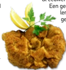
Heerlijke Weiner schnitzel

5 Tafelspitz Vlees is onmisbaar voor de Weense keuken en rundvlees speelt al eeuwenlang een belangrijke rol. Een geliefde variant is gekookt lendevees, vaak met rösti of gekookte aardappelen en een moes van appels en mierikswortel. Men beweert dat keizer Franz Joseph elke dag tafelspitz at.