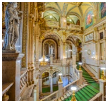
Statische trap van de Staatsoper

Deze buurt is rijk aan contrasten. Statische architecturale blikvangers grenzen aan de kleurrijke drukte van de Naschmarkt. U vindt er imposante gebouwen in diverse stijlen, zoals het historische Operagebouw en de Akademie voor Beeldende Kunst, maar ook prachtige voorbeelden van Weense art nouveau, zoals het Secessionengebäude en twee schitterende Otto Wagnergebouwen op de Linke Wienzeile. Wie van winkelen houdt, komt hier volop aan zijn trekken – in de Mariahilfer Strasse bevinden zich honderden winkels, cafés en restaurants, terwijl de Naschmarkt een heel ander aanbod laat zien. De gezellige, chaotische markt doet denken aan een oosterse bazar en is een feest voor alle zintuigen.